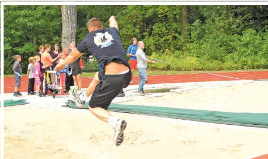
Weitsprung war eine der Disziplinen, die für das Sportabzeichen absolviert werden mussten.

Tages: Die Pupp doktor Pille mit der großen runden Brille lud die großen und kleinen Gäste zur Sprechstunde. Die „Drehwürmer“ aus Eichwalde mussten auf Grund des Regens am Vormittag mit ihren Darbietungen im Trapez- und Rhönradturnen, Artistik und Akrobatik in die Halle ausweichen, was der Stimmung aber keinen Abbruch tat.