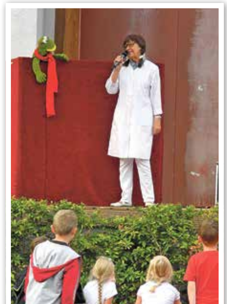
Begeisterte Groß und Klein. „Der nächste Bitte: Eine Sprechstunde mit Frau Pupp doktor Pille“