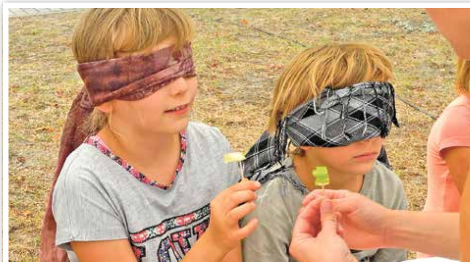
Und? ... Ernährungsquiz mit der Kita „kleine Waldgeister“