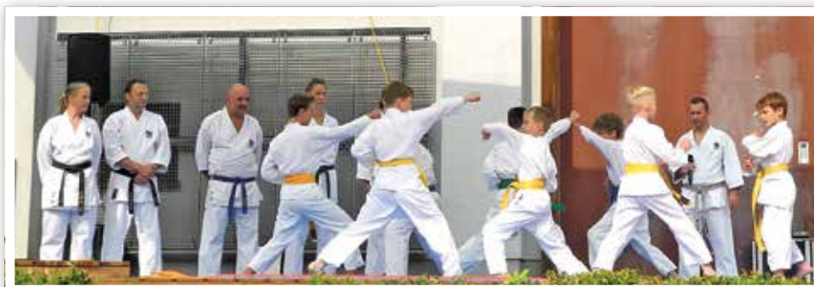
Asiatische Kampfkunst gezeigt durch die Schüler von Keiko Dojo, Schule für Kampfkunst und Bewegung

Die Außenbühne zwischen Sport- und Kulturzentrum und Schule war zentraler Ort für Vorführungen im Karate- und Stockkampf, für Tanzdarbietungen sowie für den Stargast des