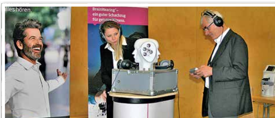
Letzte Vorbereitungen für die Hör- und Sehtests