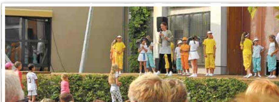
„Tanzen... weil es Spaß macht!“ – Ein breites Spektrum, was zum Mitmachen anregte, präsentierte die großen und kleinen Tänzer vom Dance point Berlin.