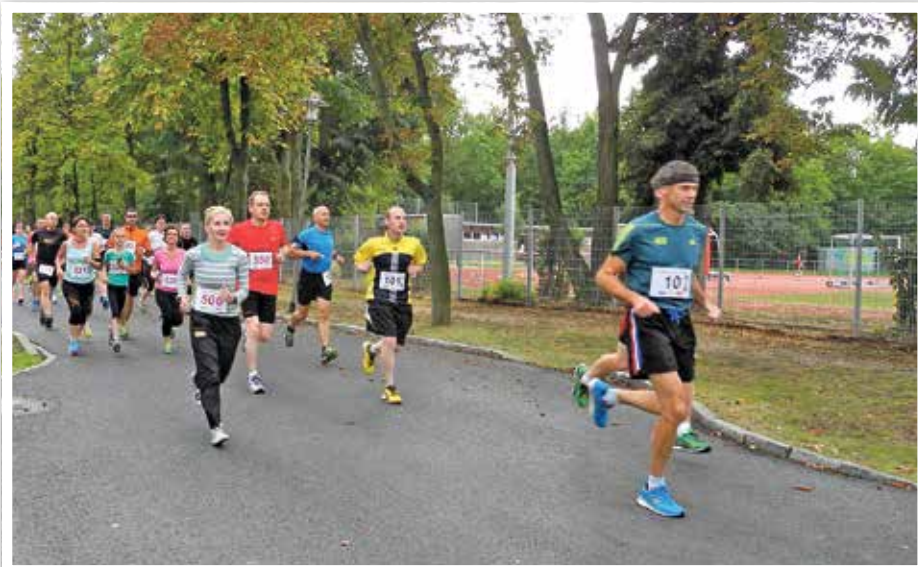
Startschuss für den Jedermanslauf über 5,10 und 15 Kilometer