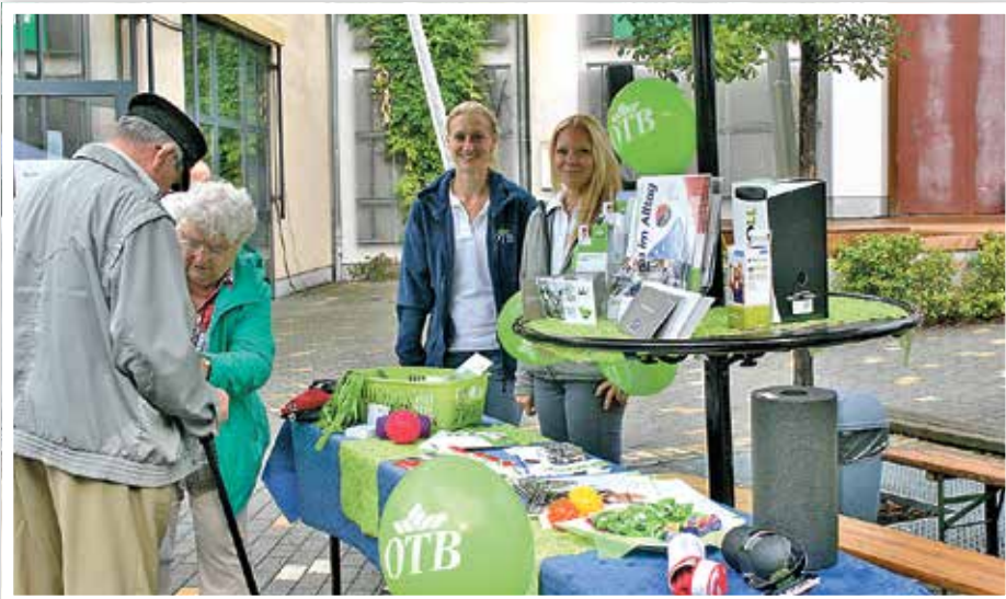
Wissenswertes und Interessantes – Dienstleister und Anbieter aus der Region informierten beim Gesundheitsmarkt über ein breites Spektrum